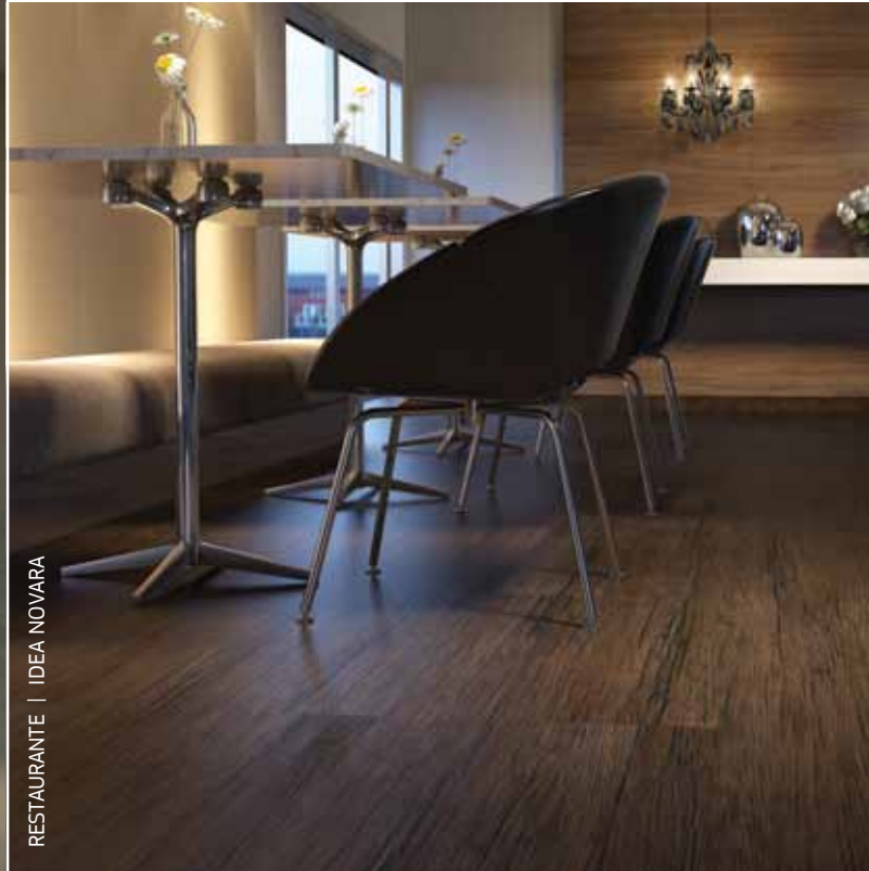
RESTAURANTE | IDEA NOVARA