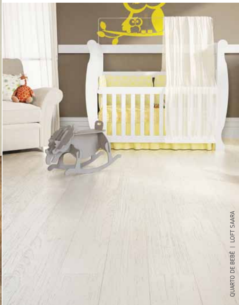
QUARTO DE BEBÊ | LOFT SAARA

Loft transforma ambientes e contribui para que todos que entrem em sua casa sintam conforto e hospitalidade. É fácil de limpar e hipoalergênico, sendo ideal para quem tem crianças em casa.