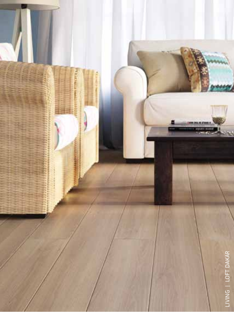
LIVING | LOFT DAKAR