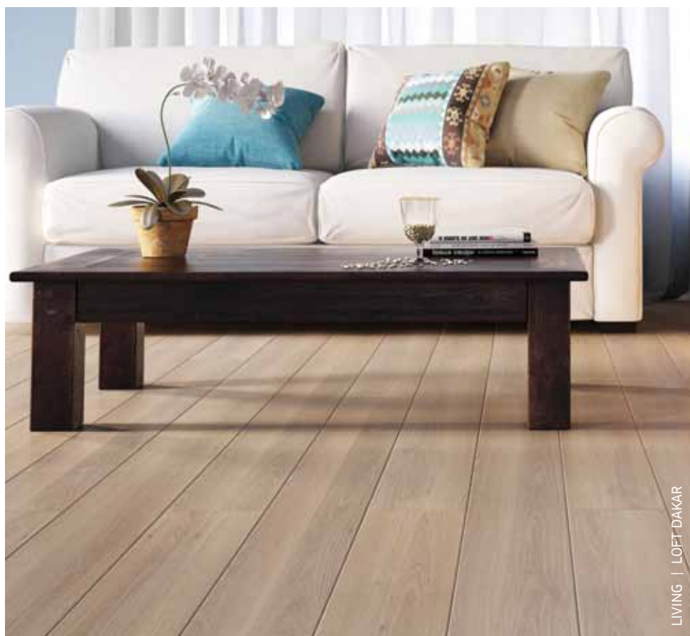
LIVING | LOFT DAKAR

Durafloor LVT é uma nova opção para profissionais de arquitetura, design e decoração , que encontram neste piso um produto inteligente e versátil, com uma ampla gama de padrões alinhados com as mais recentes tendências internacionais.