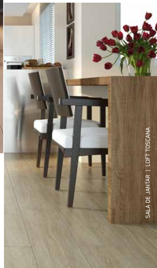
SALA DE JANTAR | LOFT TOSCANA

Durafloor LVT é uma nova opção para profissionais de arquitetura, design e decoração , que encontram neste piso um produto inteligente e versátil, com uma ampla gama de padrões alinhados com as mais recentes tendências internacionais.