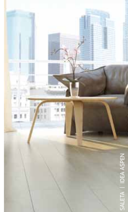
SALETA | IDEA ASPEN

Com sua linha de pisos Durafloor, a Duratex oferece ao mercado um portfólio completo de produtos que se destacam pela excelência. Durafloor LVT (Luxury Vinyl Tile), piso vinílico de última geração, é o mais recente lançamento que comprova esta dedicação em desenvolver soluções de qualidade em revestimentos para todos os tipos de ambientes comerciais e residenciais.