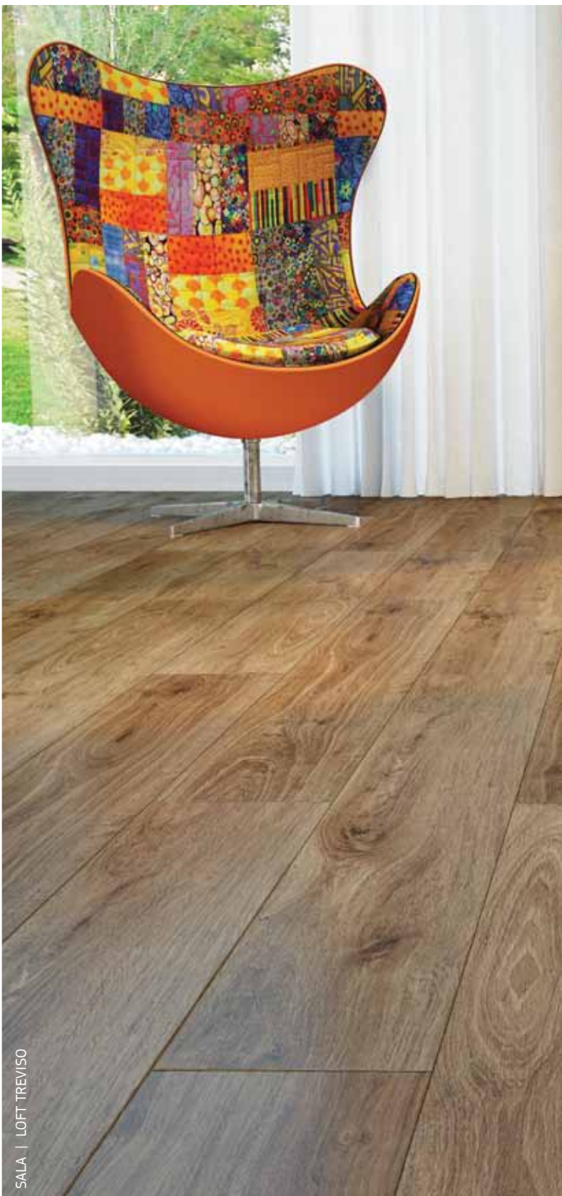
SALA | LOFT TREVISÓ