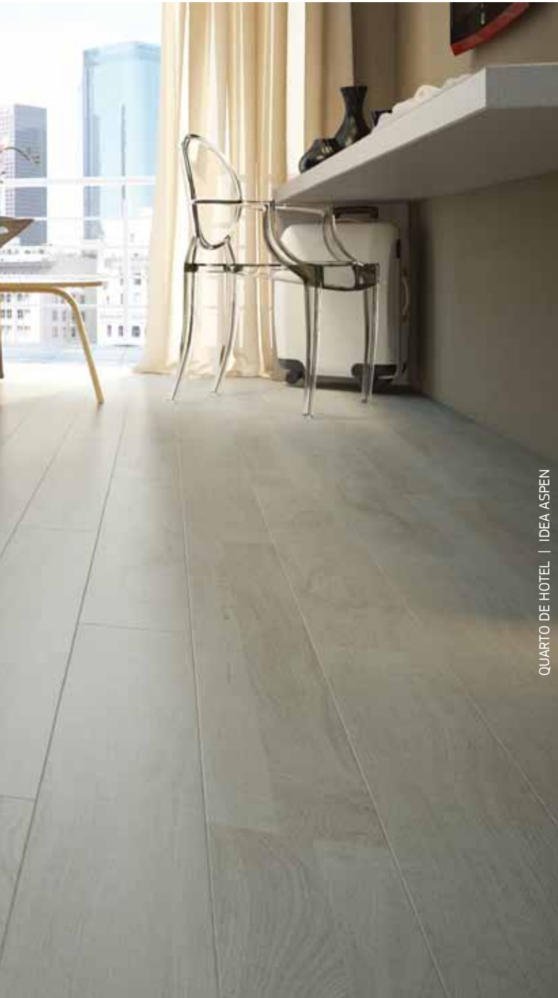
QUARTO DE HOTEL | IDEA ASPEN