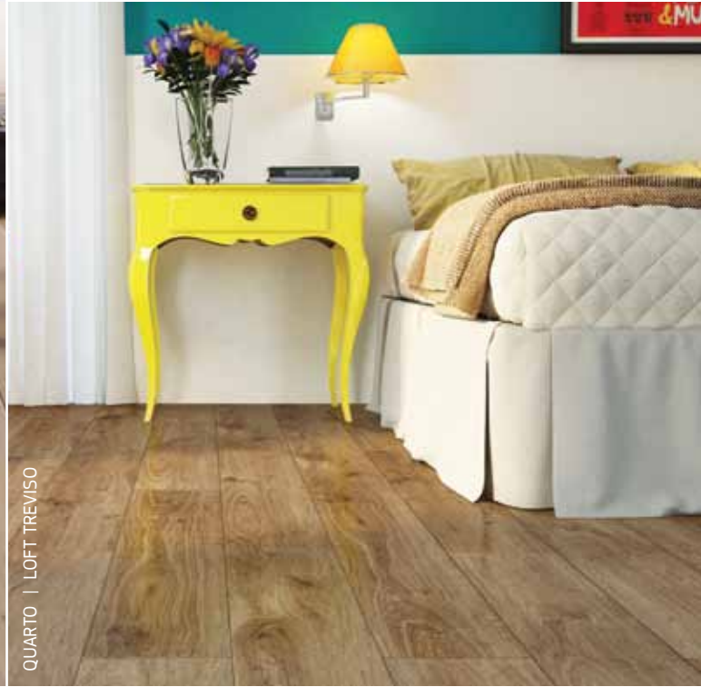
QUARTO | LOFT TREVISO