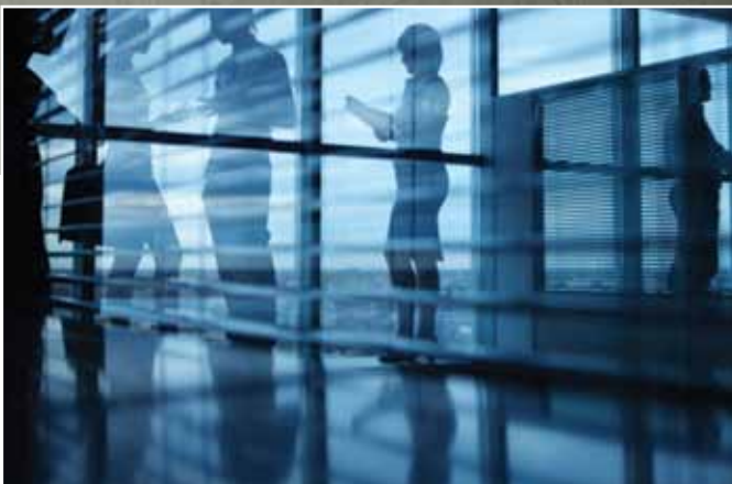
HALL DE ENTRADA | IDEA TIVOLI